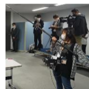
マスコミ取材: NHK・朝日新聞社・河北新報社・福島民報社・生協流通新聞 囲み取材を受ける代表团(右)