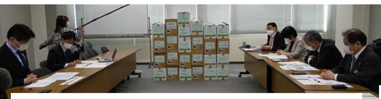
箱積みされた思いの詰まった署名179,093筆を前に行われました。