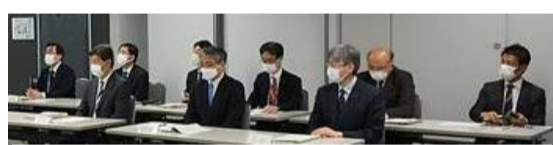
東電側 左から守副代表、松本執行役員、井口所長と後列は事務方6名が勢揃い